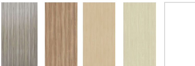
DAWN WODA ELM