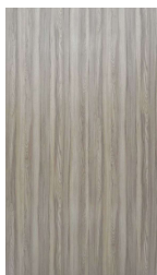
DAWN WODA ELM