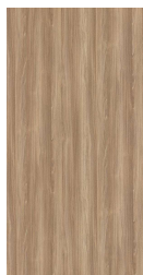
FONDLE SAMSARA MAPLE